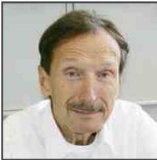
Prof. Dr. Rolf M. Zinkernagel (geb. 1944, Schweiz)