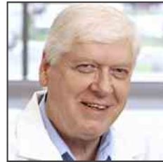
Dr. Hamilton Smith (geb. 1931, USA)

1988 - Nobelpreis für Chemie (Aufklärung der dreidimensionalen Struktur des photosynthetischen Reaktionszentrums)