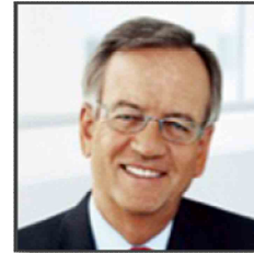
Dr. Heinrich von Pierer

Wissenschaftlicher Berater der Ganymed AG