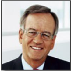
Dr. Heinrich von Pierer (geb. 1941, Deutschland)

Ehem. Vorsitzender des Aufsichtsrats der Siemens AG; als selbstständiger Unternehmensberater tätig