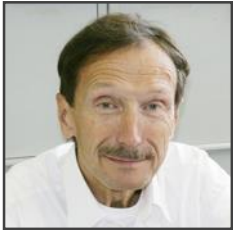
Prof. Dr. Rolf M. Zinkernagel (geb. 1944, Schweiz)