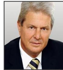
Dietmar Hopp (geb. 1940, Deutschland)

deutscher Unternehmer und Mitbegründer der SAP AG . Gilt als einer der reichsten Deutschen.