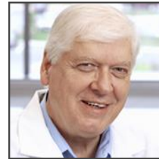
Dr. Hamilton Smith (geb. 1931, USA)

1988 - Nobelpreis für Chemie (Aufklärung der dreidimensionalen Struktur des photosynthetischen Reaktionszentrums)